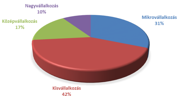
Támogatott kérelmek száma (db)

A támogatott vállalkozások 73%-a mikro- és kisvállalkozások köréből került ki, a közép és nagyvállalatok aránya 17% és 10% volt.