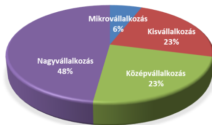
Támogatott munkavállalók megoszlása vállalat méret szerint

A támogatással érintett munkavállalók 29%-a a mikro- és kisvállalkozásoknál volt foglalkoztatott, míg 23% és 48%-uk a középvállalkozásoknál, illetve nagyvállalatoknál állt alkalmazásban.